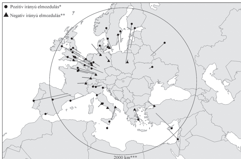
2. ábra: A Budapestről diszkont légitársaságok járataival elérhető célállomások költségtávolság-értékei (2 hét) Cost distance of European cities from Budapest with LCC flights (2 weeks)

* A célállomás relatív pozíciója „közelebbi”, mint azt a földrajzi távolsága indokolná, és a vonal hosszúsága adja meg a pozitív irányú elmozdulás mértékét.